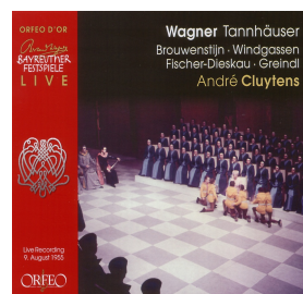
C 643 043 D Tannhäuser 9. August 1955