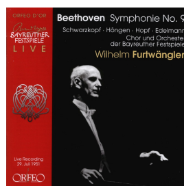
C 754 081 B Symphonie No. 9 29. Juli 1951