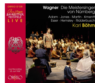
C 753 084 L Die Meistersinger von Nürnberg 25. Juli 1968