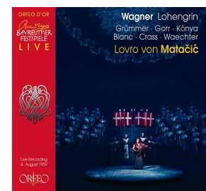
C 691 063 D Lohengrin 4. August 1959