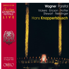
C 690 074 L Parsifal 13. August 1964