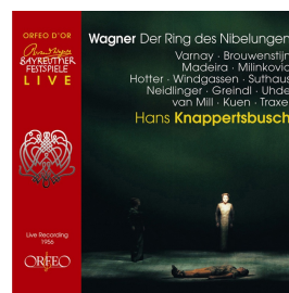
C 660 513 Y Der Ring des Nibelungen 13. – 17. August 1956